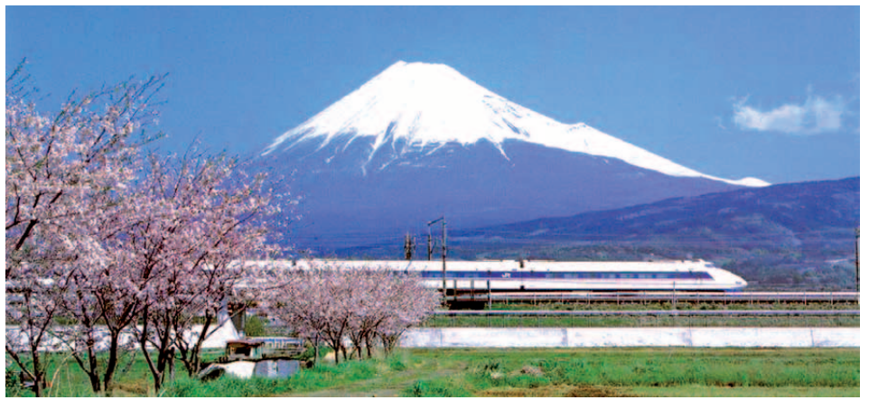
Der Hochgeschwindigkeitszug Shinkansen mit dem Berg Fuji im Hintergrund

Okinawa ist die südlichste Präfektur Japans mit tropischem Klima und wunderschönen Stränden. Die Insel zählt zur Ryukyu-Inselgruppe, deren südlichster Punkt nur ca. 125 km von der Insel Formosa (Taiwan) entfernt liegt. Durch die große Entfernung zum japanischen Festland haben sich auf der Inselgruppe unterschiedliche Kulturen und Sprachen entwickelt.