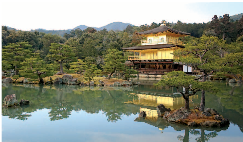
Goldener Pavillon, Kyoto